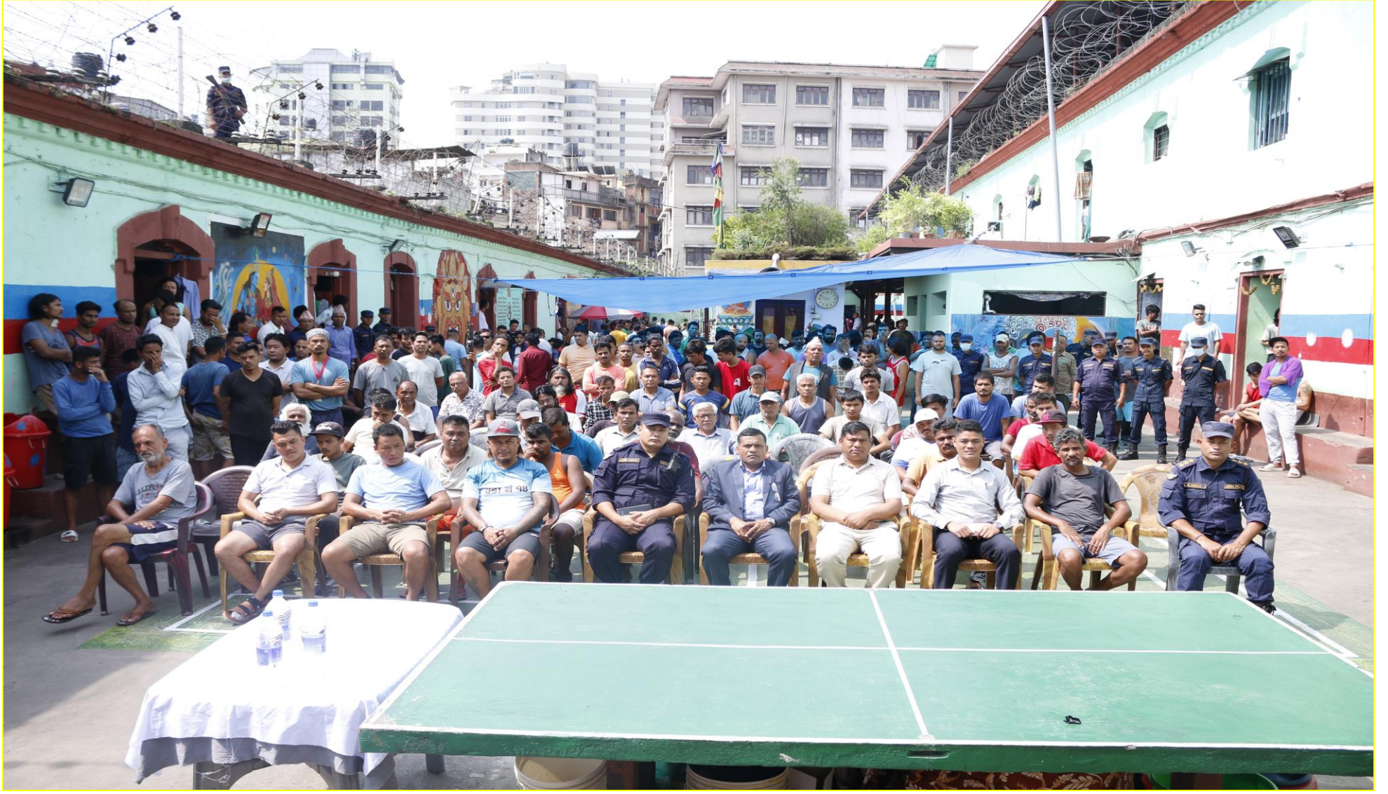
डिल्ली बजार कारागारमा लागु औषध रोकथाम तथा नियन्त्रण सम्बन्धि सचेतना मुलक कार्यक्रम